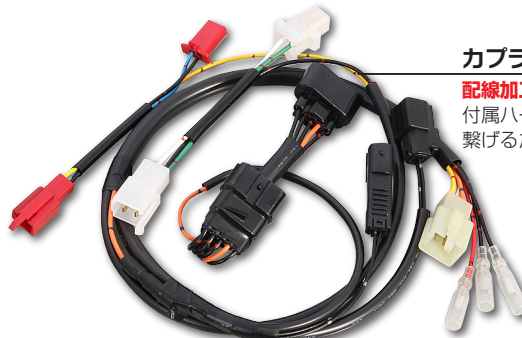
カプラーオンハーネス

i-map (インジェクションコントローラー) の組み付けが、専用カプラーオンハーネスにより配線加工不要に。ユーザーは i-map を取り付けた後、DIP スイッチでマップを選択します。(マップ数は車種により異なります。) また、当社製以外のパーツの装着やユーザーの好みに対応させるため、ユーザーオリジナルマップ (※ 1) の作成も可能です。