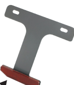
リフレクター KIT 801-0800300 ¥2,300+税