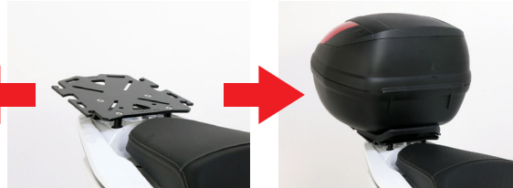
使用例イメージ (参考: PCX)