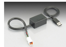
PC インターフェイスクーブル

レブリミット: 10,000rpm ※レブリミットの回転数は表記まで上昇することを保証するものではありません。 ※1, オリジナルマップを製作するにはインターネット環境が整ったパソコンと PC インターフェイスクーブル(763-0500900 ¥7,800+税) (右参照) が必要です。弊社 WEB サイトから設定ソフトをダウンロード(無料)してパソコンで設定して下さい。