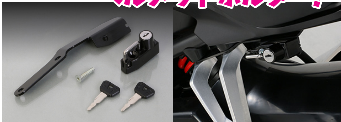
タンDEMステップ部にヘルメットロックを装着し、日常の使い勝手を向上させます!

CB650R(RH03) 適合追加! K・TOUR より販売開始 出先での使用に便利な ヘルメットホルダー!