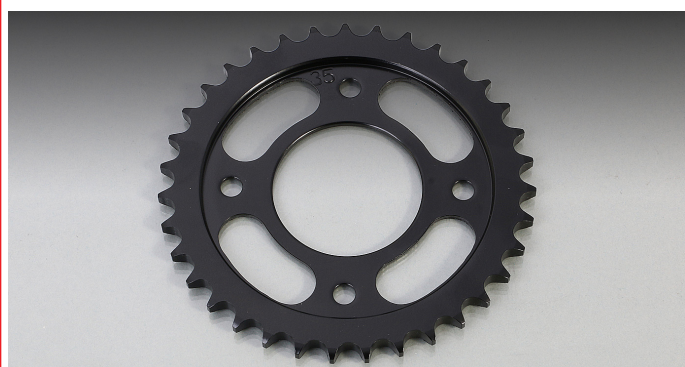
428 サイズ対応ドリブンスプロケット(35T)リア用ニューラインナップ。

428 サイズ対応ドライブスプロケット(14T)ニューラインナップ。 ドライブスプロケットには S45C(高炭素鋼) を採用。グロムの場合は、1 サイズ上のドライブチェーンが使用可能になりますので出力を増大させたエンジンに対応。チェーンサイズを大きくする事で、耐久性を向上させ、メンテナンスサイクルを軽減できます。