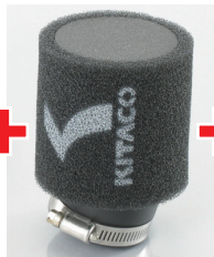
スーパーパワークリーナー (φ35) 515-6000350 ¥2,800+税