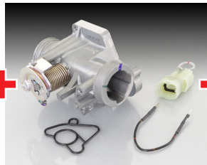
ビッグスロットルボディ SET