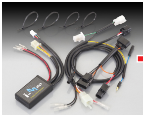
i-map カブラーオン SET