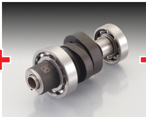
ハイカムシャフト