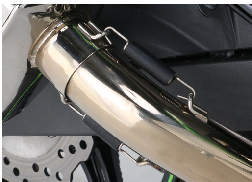
エクストリーム R マフラー Z125 PRO